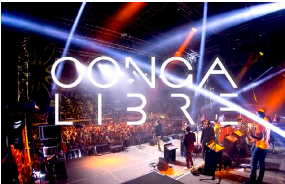
Conga Libre, une équipe de professionnels qualifiés à votre disposition.

Fort de dix années d'existence, Conga Libre jouit d'une vraie expérience de groupe, qu'elle soit musicale, créative ou scénique, forte de plus d'une centaine de concerts sur les plus prestigieuses scènes. L'orchestre est aujourd'hui reconnu et salué, comme en témoigne le plébiscite du public, des organisateurs de spectacles et des médias. Conga Libre est donc une figure incontournable de la nouvelle génération musicale latine en France, en Europe et dans le monde ! Parallèlement à cette activité musicale scénique et créative, Conga Libre propose des actions culturelles ciblées dispensées par les membres du groupe, musiciens professionnels aux nombreuses références, diplômés de Conservatoire, titulaires du Diplôme d'État et enseignants dans des établissements réputés.